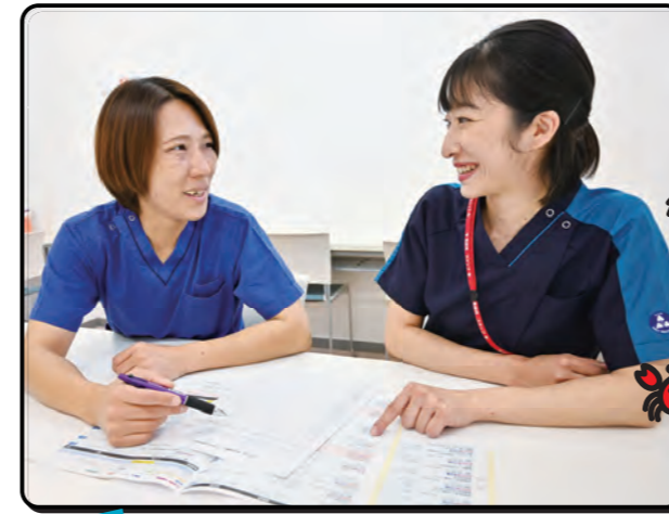
外部研修への参加や資格取得もバックアップ

教育委員会では、AMGのラダーと独自の経年別研修を併用し、入職後2年間で一人前の看護師を目指す研修プログラムを立案。新卒者は3か月間のローテーション研修後に配属部署を決め、1年間のメンターシップと部署全体のOJTで成長を支えています。入職2年目には、事例検討会や手術室などの特殊な部署で学ぶ他科研修も用意し、看護の視野を広げていけるようサポート。中途入職者にはキャリアに合った指導計画を立て、業務に慣れるまで1対1のOJTを実施して、第2新卒者やブランクのある方には新卒と同じ研修を案内するなど、臨機応変に対応しています。