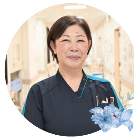
看護部教育責任者